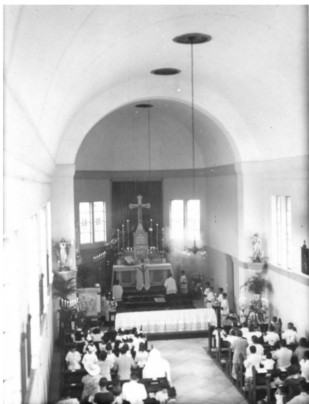
Eerste communie in 1935