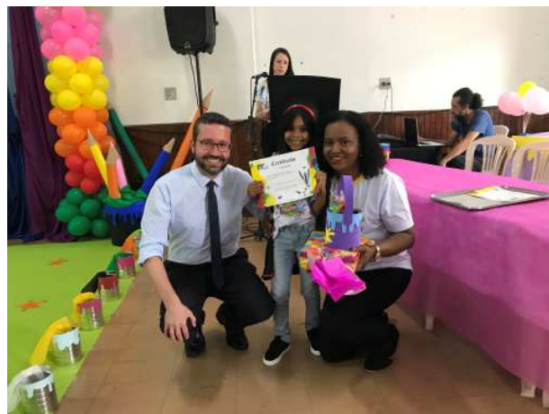
Een moment om te vereeuwigen

vormingsaangelegenheden. Een kunstig versierd "diploma" van de goed doorlopen jaren op deze bewaarschool, uit de handen van de directeur en een onderwijzeres, telkens met de schoolverlater in het midden. Een beroepsfotograaf neemt deze foto. Dit is het schema van allerhand momenten van hun toekomstig leven. Dit was het feestelijk begin van het groeiende bestaan van deze kinderen in de samenleving.