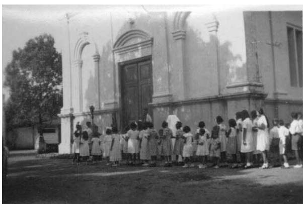
Palmprocessie in Cheribon in 1935