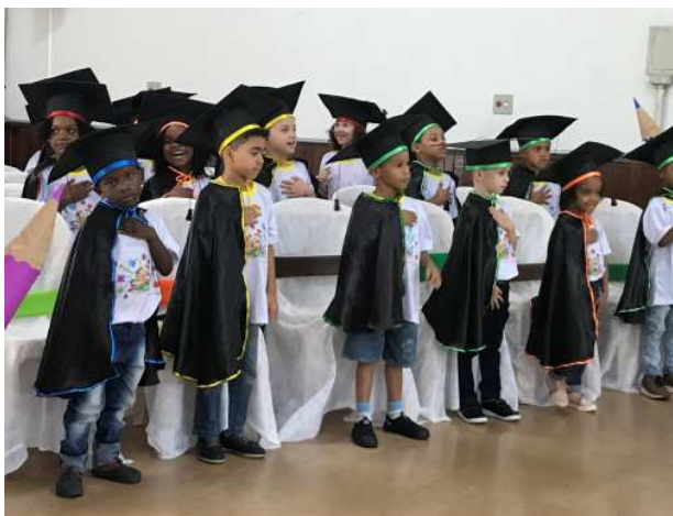
De afstuderende leerlingen van de bewaarschool

staande, met de hand op je hart; zo beginnen alle officiële vieringen bij verschillende gelegenheden. Verder waren er eenvoudige dansjes, één over sterren; de ander over bloemen.