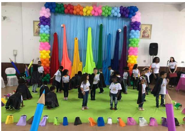
De kinderen doen een dansje

Het bestuur van de bewaarschool was aanwezig, ook hun ouders en grootouders; en alle dienstpersoneel die hun taak hebben bij het functioneren van deze prille