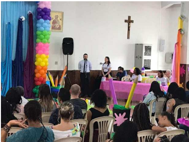
Diploma-uitreiking op de bewaarschool

Op deze symbolische dag, de 12.12, schrijft de correspondent uit Belo Horizonte (Brasil) zijn bijdrage aan het laatste nummer van Bulletin.